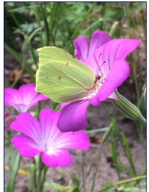
Citroenvlinder op boldenik